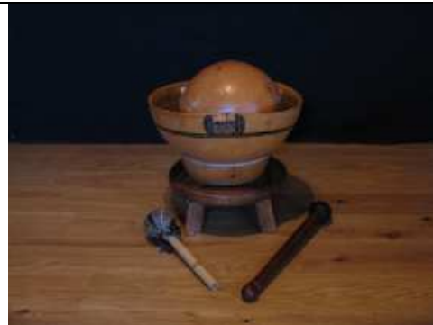
Le tambour d'eau africain