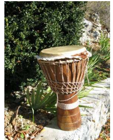
Le djembé africain