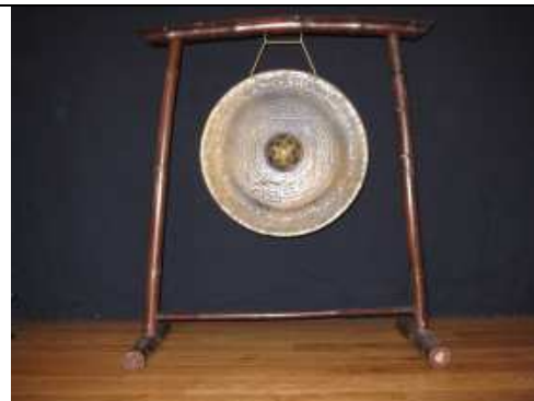
Le gong vietnamien