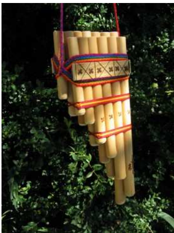
La zampoña des Andes